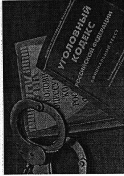
Прокуратура Кировской области

Соответственно, в связи с вышеизложенным, суд апелляционной инстанции не вправе исследовать доказательства, опровергающие подтверждающие либо обвинение.